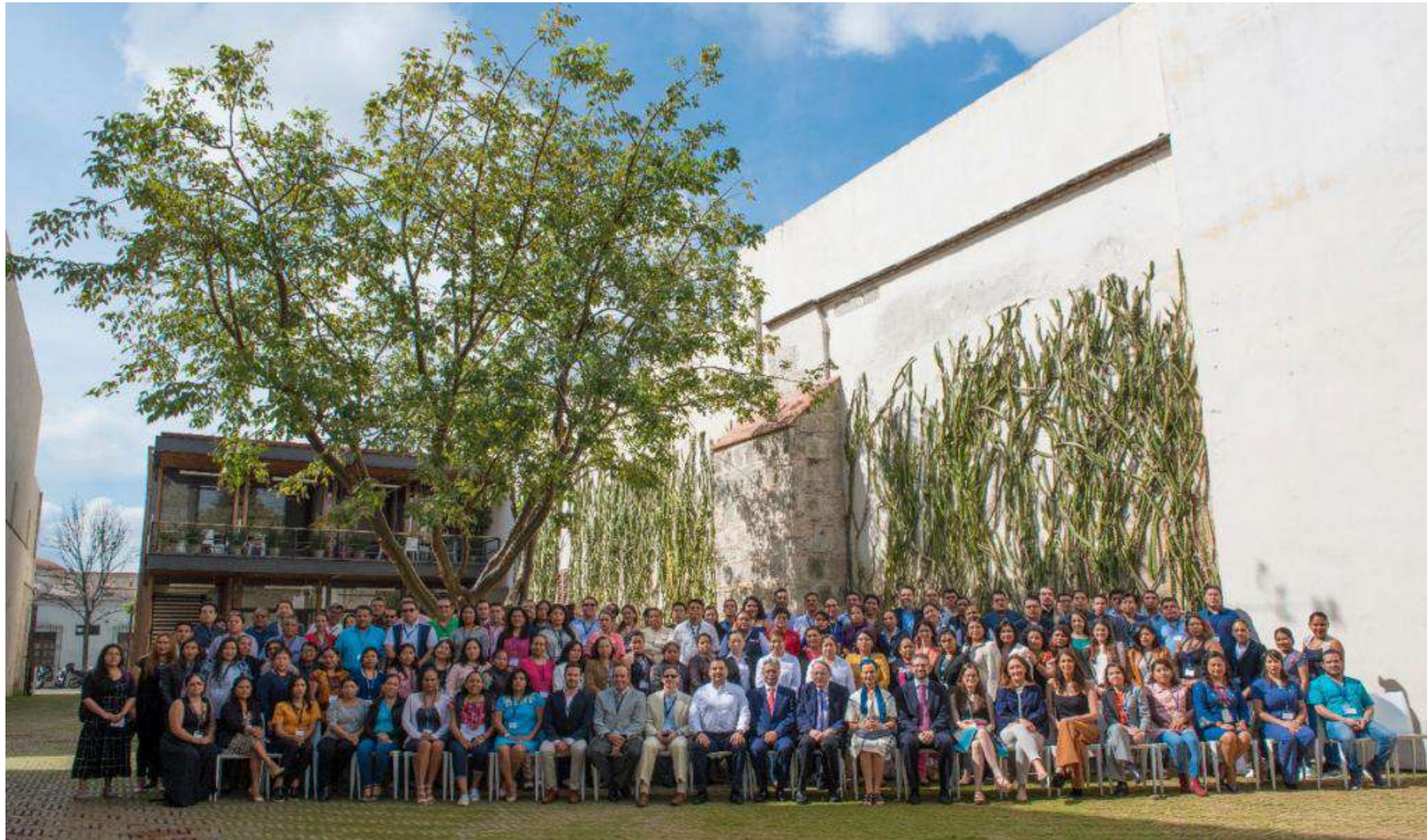
Foto de grupo