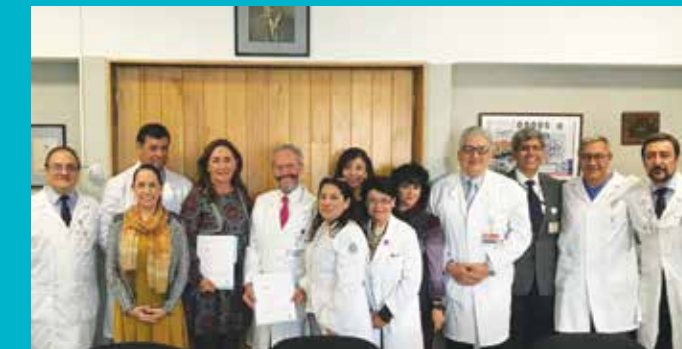
Firma de convenio de colaboración académica AMSA-Hospital General Dr. Manuel Gea González.