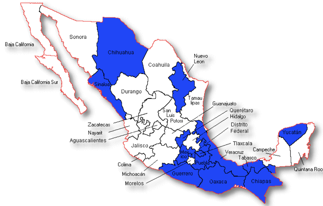
Por entidad federativa

244 participantes de 14 entidades federativas